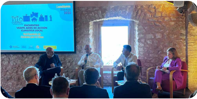
Presenza de Vedra no encontro polos vinte anos de acción climática local da Rede Española de Cidades polo Clima.