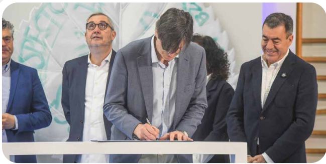
Sinatura de Vedra adheríndose ao Proxecto Rede de Concellos contra o Acoso Escolar.