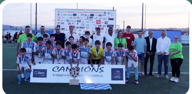
IV Torneo fútbol 11 sub 12 Vedra – Boqueixón E.D. 2026.