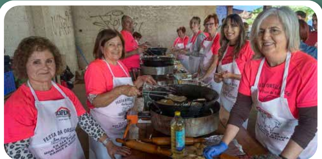
36ª Festa da Orella en San Fins.