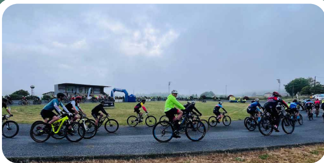
XV BTT Cicloturista da Camelia co Club Ribadoulla.