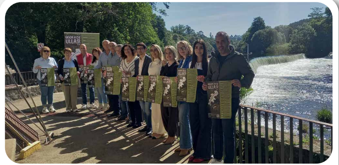
Presentación do Goza do Ulla 2026. Unha iniciativa con 20 concellos participantes para a posta en valor do río Ulla.