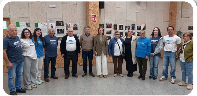
Visita da Directora Xeral de Xuventude ao Voluntariado Interxeracional no Centro Sociocultural de Vedra.