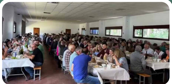
Festa do Porco á Brasa en Trobe.