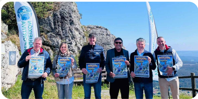
Presentación do Campus Donato, en colaboración coa Vedra-Boqueixón E.D.