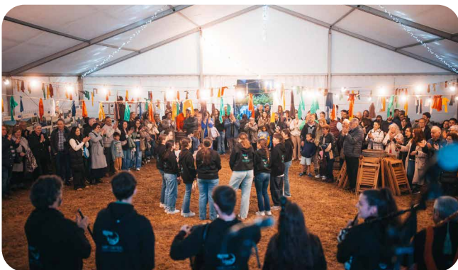
Todo o que pasou os días 8, 9 e 10 de maio nas súas redes sociais #festival-marco.