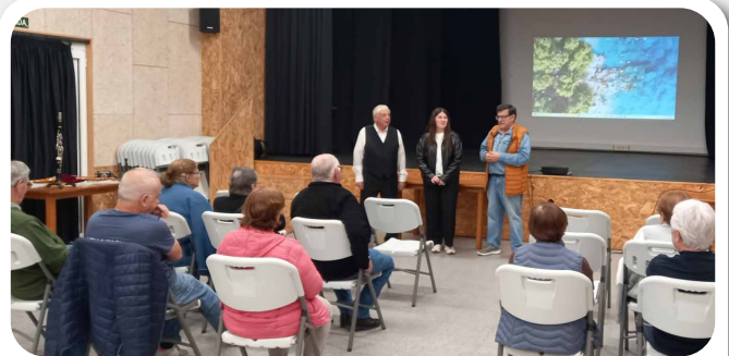
Exposición de fotografía de José de Lucía, artesán, músico e fotógrafo, co Voluntariado Interxeracional.