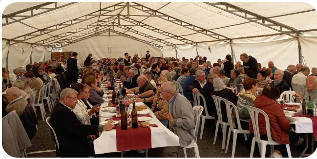
33ª Romaría da Terceira Idade de Vedra, con máis de 300 persoas asistentes.