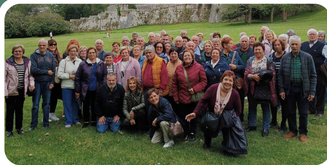
Excursión da Asociación O Burgo.