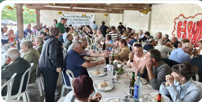
Xantar Homenaxe á Familia Mosqueiro a iniciativa veciñal.