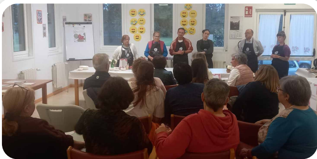
Obradoiro "O Sabor da Camelia" co Voluntariado Interxeracional no Centro Sociocultural de Vedra.