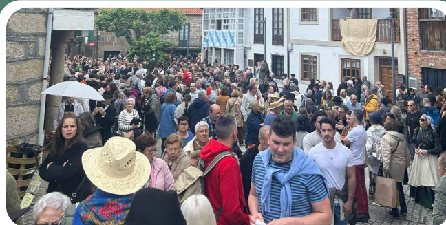
Excursión a Raigame da Asociación Cultural San Campio.