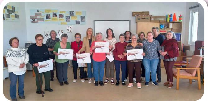
Acción solidaria: Nas mans da avoa doa 500 € á Fundación Andrea.