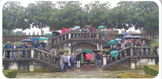
Excursión a Salceda de Caselas nas XXX Xornadas Arredor da Camelia 2026.