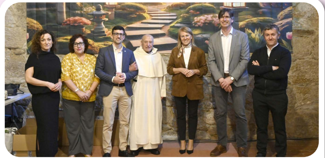
Vedra presente na X Exposición da Camelia e do Bonsai no Concello de Padrón.