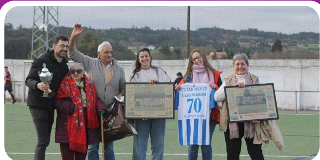
Saque de honra da Familia Mosqueiro organizado polo Club San Mamede.