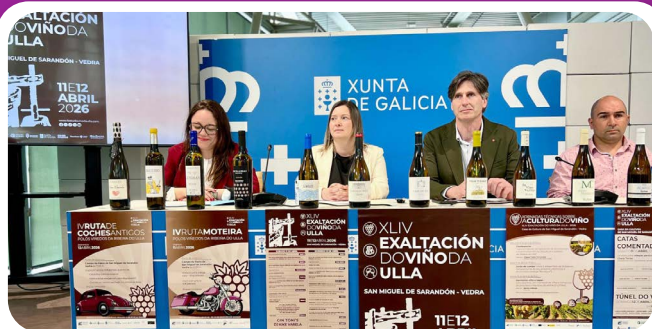
Presentación da XLIV Exaltación do Viño da Ulla organizado pola Comisión de Festexos "Festa do viño 2026".