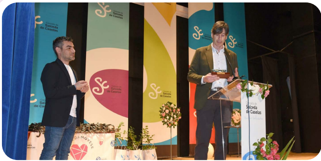
Acto de irmandade co Concello de Salceda de Caselas nas súas XVII Xornadas da Camelia.