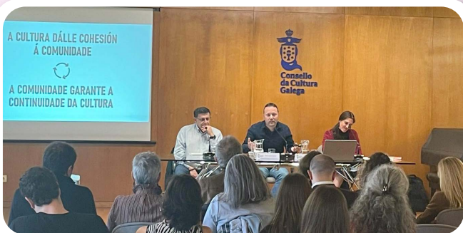
Vedra presente no Encontro Cultura e Concellos do Consello da Cultura Galega.