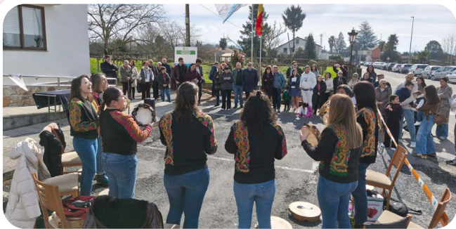
Actuación da Asociación Cultural Silandeira dentro da programación das XXX Xornadas da Camelia.