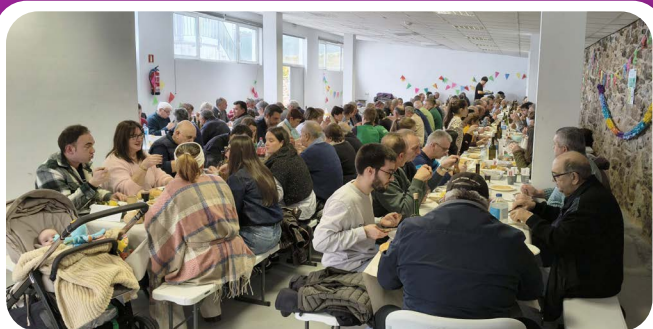
Laconada coa Comisión de Festexos de San Pedro de Sarandón.