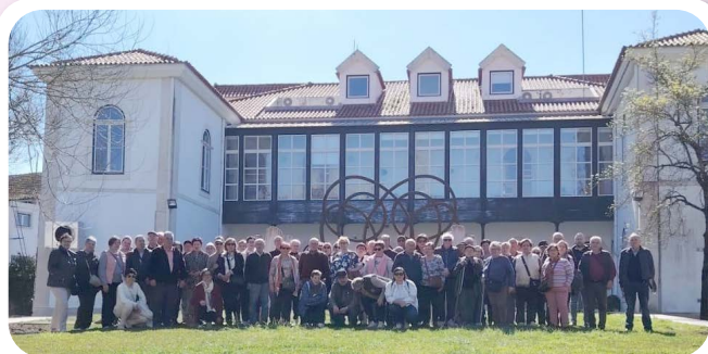
Excursión a Portugal da Terceira Idade de Vedra.