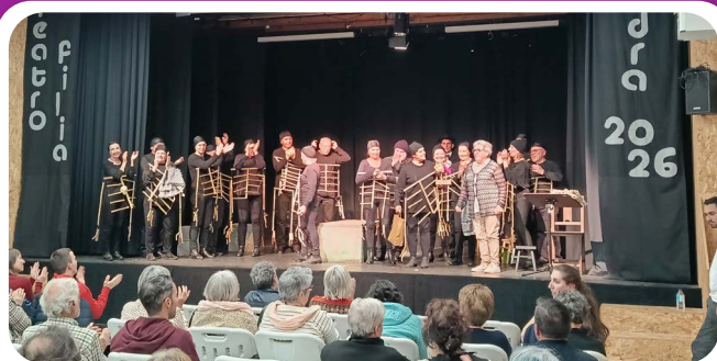
XXI Mostra de Teatro Amador de Vedra TEATROFILIA 2026 da Asociación Cultural Papaventos.