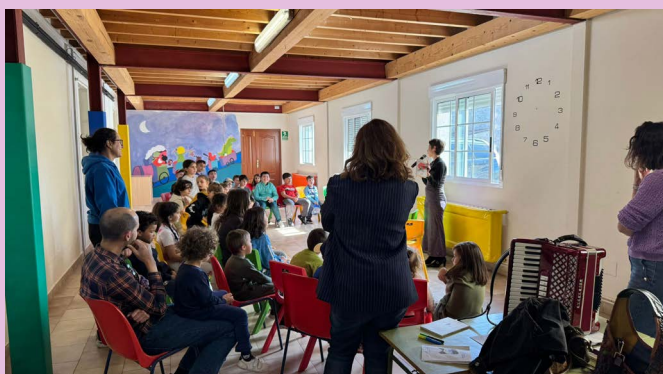
Celebración do Día da Poesía na Ludoteca.

Partindo desta premisa o mes de abril ven cargado de actividades onde a maior parte delas estarán