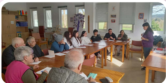
Acción Formativa do Voluntariado Interxeracional.