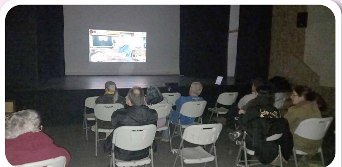
Proxección do Documental 360 Curvas no Centro Sociocultural de Vedra.