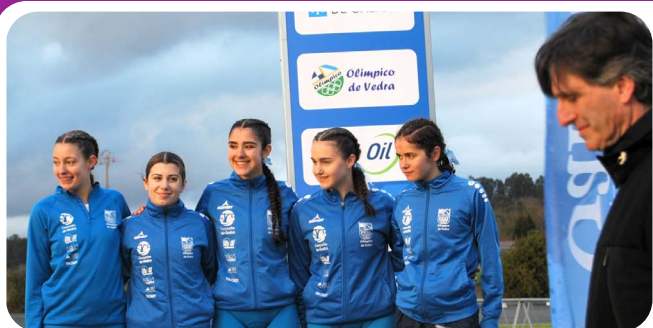
Duatlón de Vedra 2026. Máis de 70 equipos e centos de deportistas participan desta proba de primeiro nivel autonómico, que reafirma ao Club Olímpico de Vedra como referente nesta disciplina.