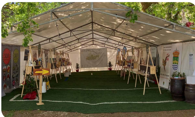
Mostra dos Concellos da Ribeira do Ulla.