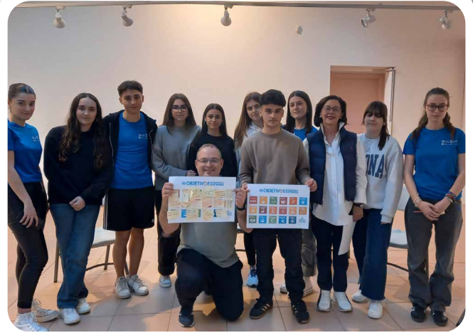
Formación do programa europeo Youleaders, co noso voluntariado xuvenil.