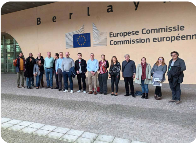
Vedra participou no evento final do proxecto europeo Elab-hause.rur celebrado en Bruxelas no marco do Festival da Nova Bauhaus Europea organizado pola Comisión europea.