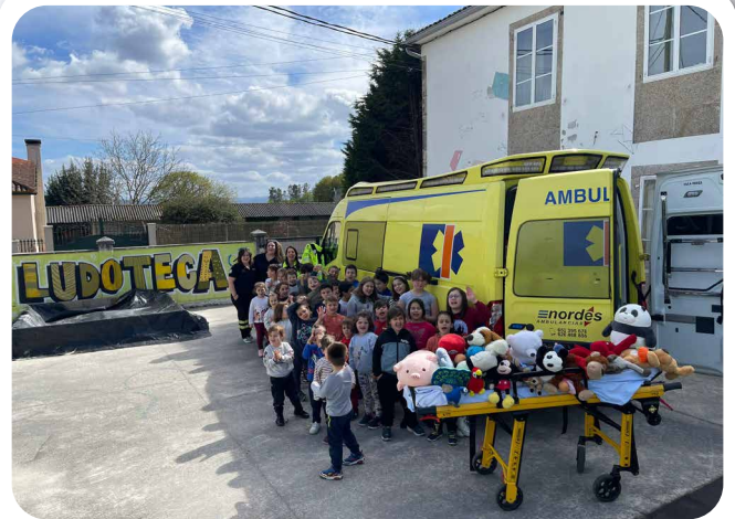
Obradoiro sanitario na Ludoteca.