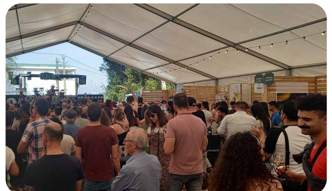
Mostra dos Viños da Ribeira do Ulla.