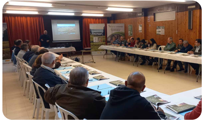
Xornadas técnicas sobre a cultura do viño.