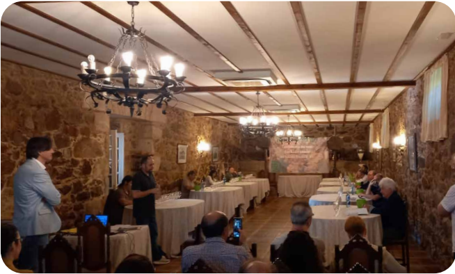
Cata concurso dos viños da Ribeira do Ulla.