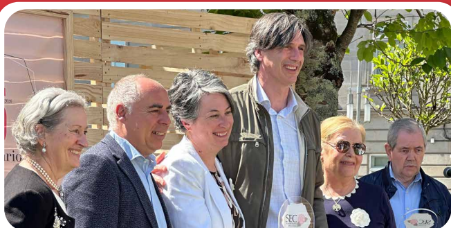
A Asociación Amigos da Camelia Val do Ulla presente no 25º aniversario da Sociedade Española da Camelia (SEC).