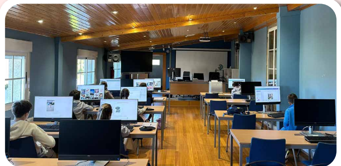
Formación en IA para a cativada na Aula Cemit de Vedra.