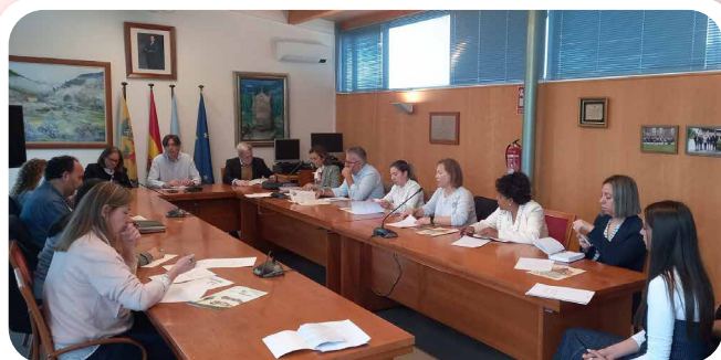
Reunión de traballo dos Concellos da Subzona Ribeira do Ulla da D.O. Rías Baixas en Vedra.