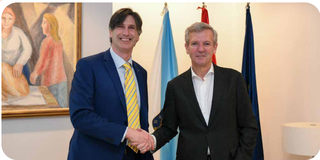
Encontro do alcalde de Vedra co Presidente da Xunta de Galicia.