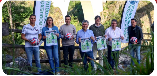
Acto de Presentación do IV Torneo F11 Sub12 organizado pola Vedra-Boqueixón ED.