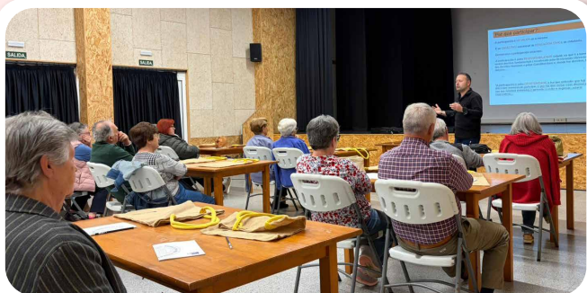
Programa Camiños do Coñecemento en Vedra.