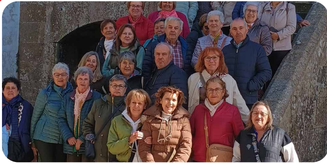
Excursión da Asociación O Burgo a Vilalba.