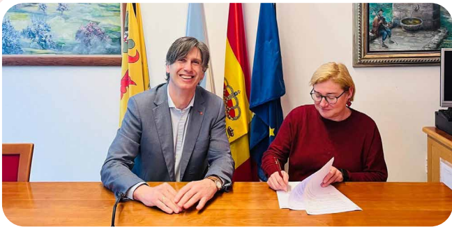
Sinatura da toma de posesión da primeira secretaria muller habilitada nacional de Vedra.