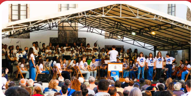
70 anos da Canción Galega. Festival da Escola de Música de Santa Cruz de Ribadulla en colaboración co CEIP Ortigueira.