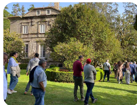
Algunha das actividades das Xornadas Técnicas Arredor da Cultura do Viño