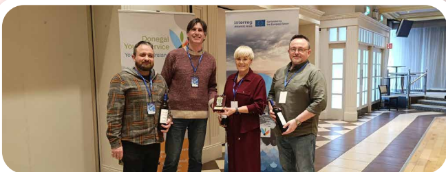
Asistencia de Vedra como entidade convidada pola Cámara de Comercio de Santiago de Compostela ao evento organizado en Donegal (Irlanda) no marco do proxecto ATLIC. Ao citado evento asistiu a Presidenta do país, Catherine Conolly así como representación de todos os países socios.