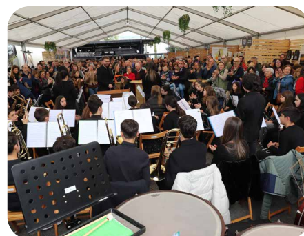
A XLIV Exaltación da Festa do Viño da Ulla.