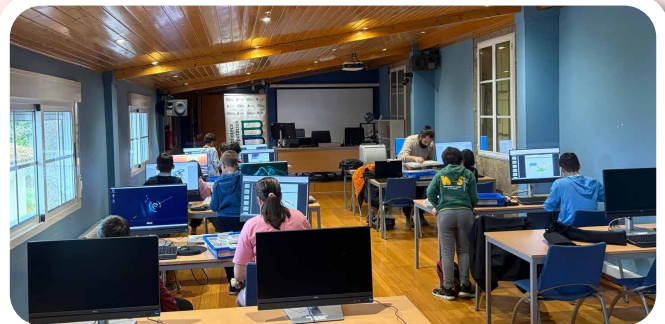
Curso de robótica Lego Wedo impartido pola Deputación da Coruña.