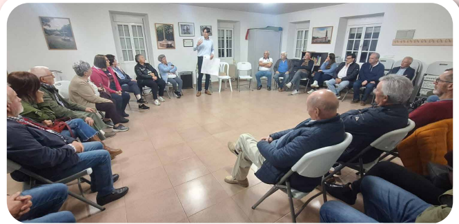
Comezaron as xuntanzas do alcalde polas 12 parroquias de Vedra.