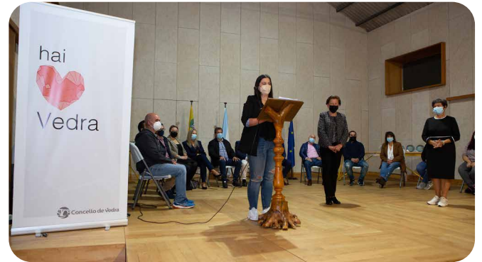
Intervencións de 3 iniciativas do voluntariado en Vedra na Crise da Covid-19.