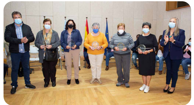
Voluntariado Senior de acompañamento social.