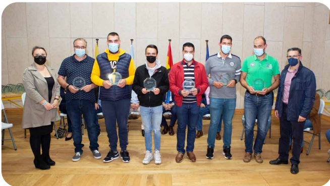
Voluntariado Protección Civil de Vedra.