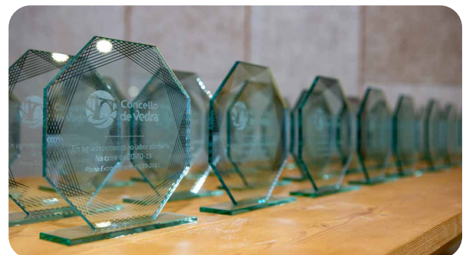
Agasallos en recoñecemento da acción voluntaria en Vedra.