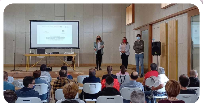
Formación sobre medidas hixienico-sanitarias e de seguridade na hostalaría no contexto de Covid19 na Nave da Estación e organizada polo GDR.