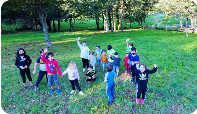
Festa de Outono proposta pola ANPA do CEIP Ortigueira.