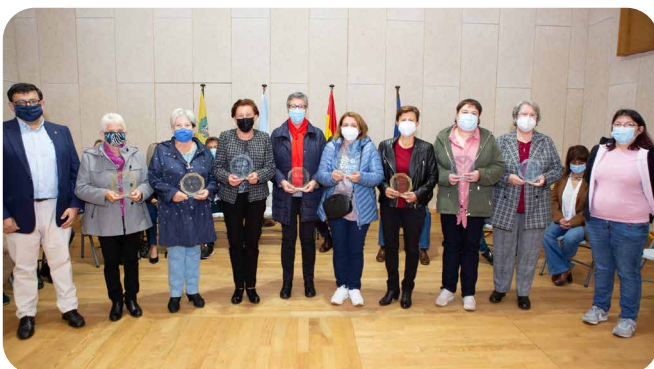
Voluntarias para a elaboración de máscaras.