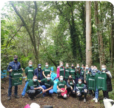
Así foi a visita da directora xeral de xuventude ao Proxecto de Iniciativa Xove ERRADICADESCANTIA da Asociación Amabul.