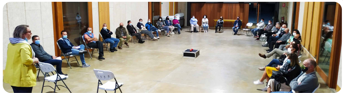
Charla coas asociacións de Vedra "A importancia do labor asociativo. Reactivando experiencias para a transformación do territorio".