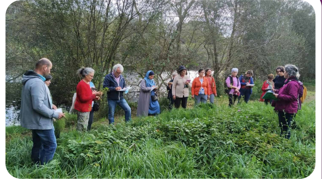
Formación sobre "Recoñecemento e utilidades das plantas medicinais" proposta pola Asociación Herbamoura e o Sindicato Labrego Galego coa colaboración da AAVV de San Miguel de Sarandón.