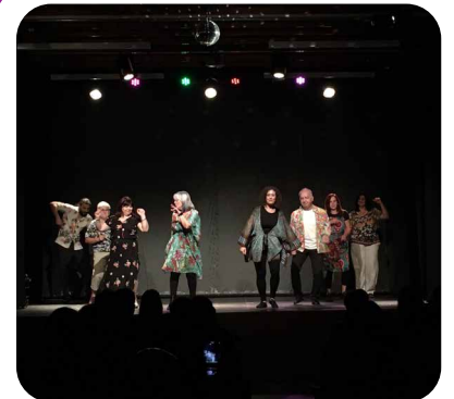
Xacovedra, dentro do Circuito Galego de Teatro Amador de Vedra celebrado durante as dúas últimas fins de semana de outubro.