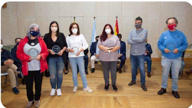
Voluntariado de acompañamento telefónico na Covid-19.