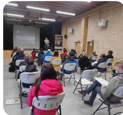
Así foron as Xornadas Micolóxicas Cogomelar da Asociación AMABUL.