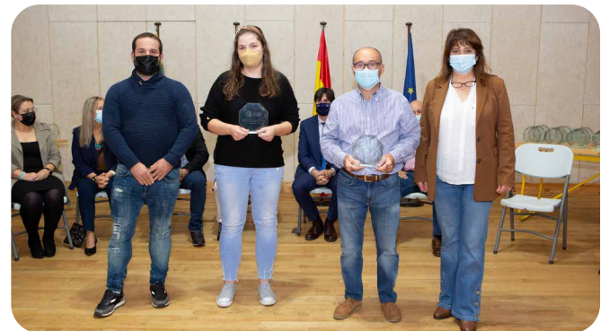
Voluntariado de emerxencias na Covid-19.