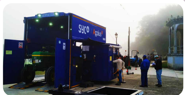
ITV en Vedra.