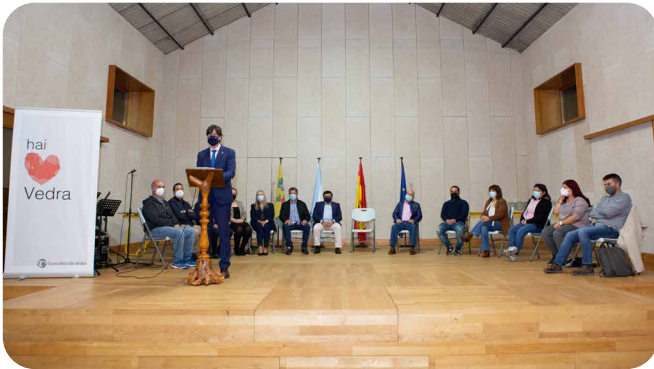
Pleno extraordinario de homenaxe ao voluntariado en Vedra na Crise da Covid.