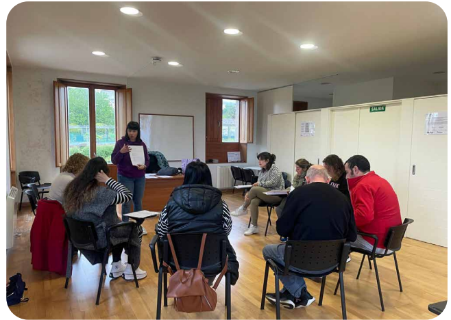
Curso de monitorado de transporte e comedor escolar na Casa da Estación.