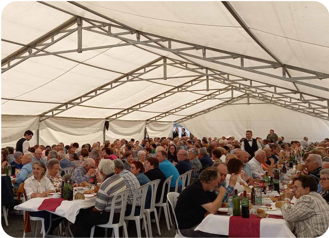
XXXI Romaría da Terceira Idade de Vedra.