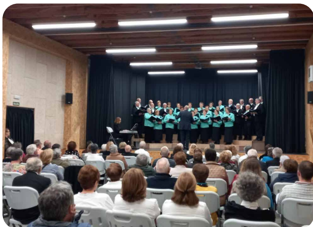
Día das Letras Galegas en Vedra: O Festival das Letras Galegas.