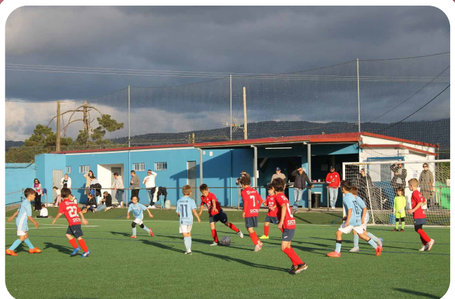
Torneo F-8 do C.D. San Mamed.