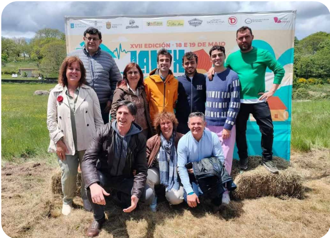
Irmandade entre a camelia de Vedra e o castiñeiro de Riós no Festival Latexos do Rural.