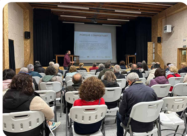
Entrega de composteiros da campaña de compostaxe en Vedra.