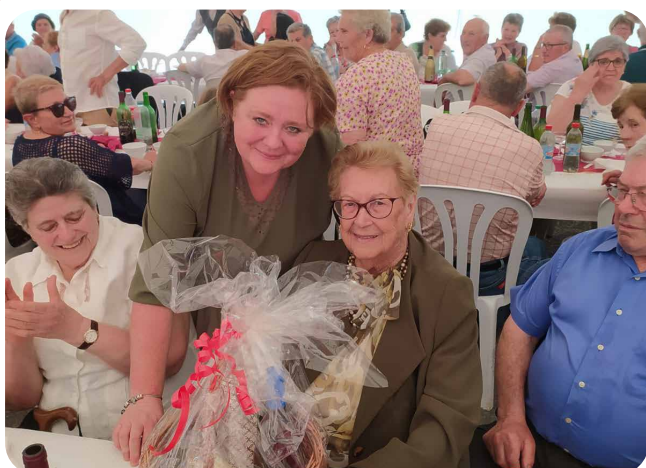
Entrega de agasallo á nosa maior na Romaría da Terceira Idade.