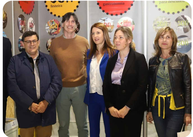
Presenza de Vedra no Gastrotur no Concello de A Estrada.