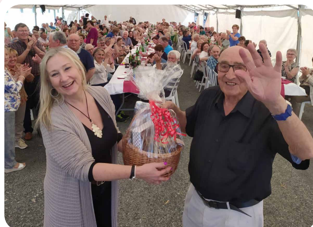
Entrega de agasallo ao noso maior na Romaría da Terceira Idade.