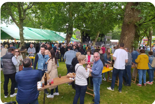
XXIV Festa da Orella en San Fins de Sales.