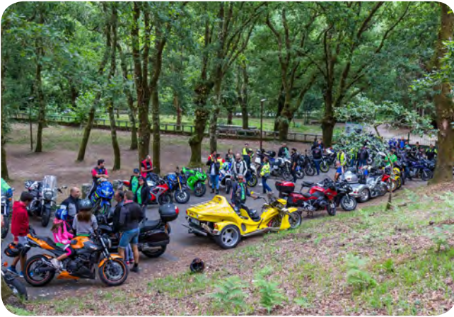
XXII Concentración de motos Val do Ulla os días 16, 17 e 18 de Agosto.