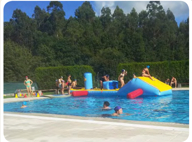
Festa da Piscina con inchables, música...