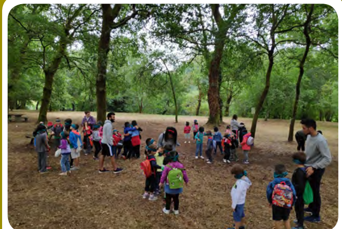
Proxecto Aulas de Verán da Asociación Medioambiental Amabul.