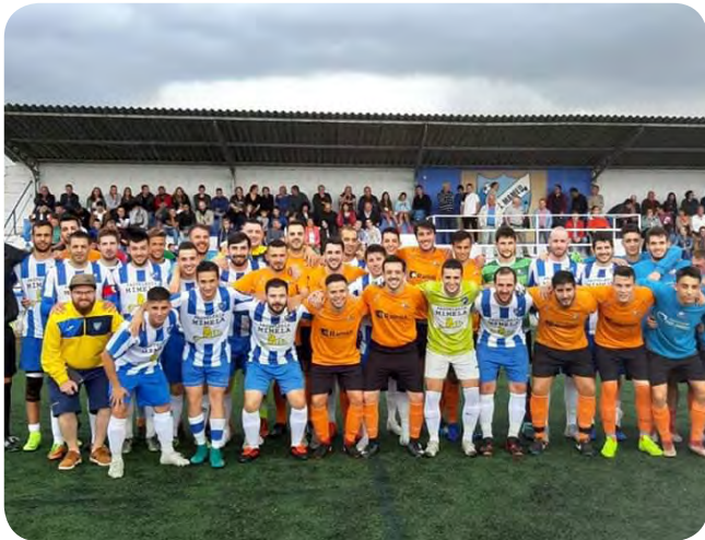
Trofeo Concello de Vedra no campo de Fútbol de San Mamede de Ribadulla.