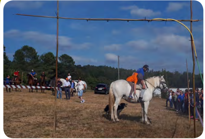
Programación cultural arredor do Santiaguíño: concentración de espantallos, festa infantil, ruta cabalar,...