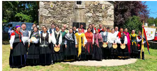
Fotos de grupo dos inicios da asociación e da actualidade dos conxuntos de baile, música e pandeiretas da Asociación Cultural Santiaguíño nas festas que lle dan nome.