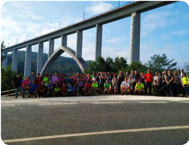
Etapa do Goza do Ulla en Vedra o domingo 4 de Agosto.