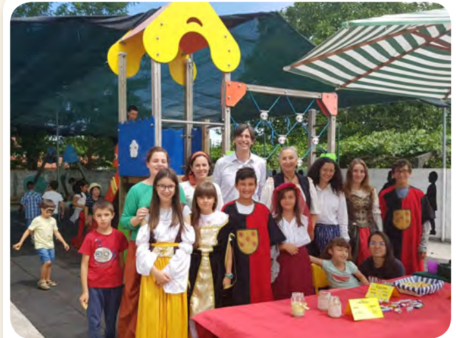
Ludoverán, desenvolveu en agosto as súas actividades e obradoiros.