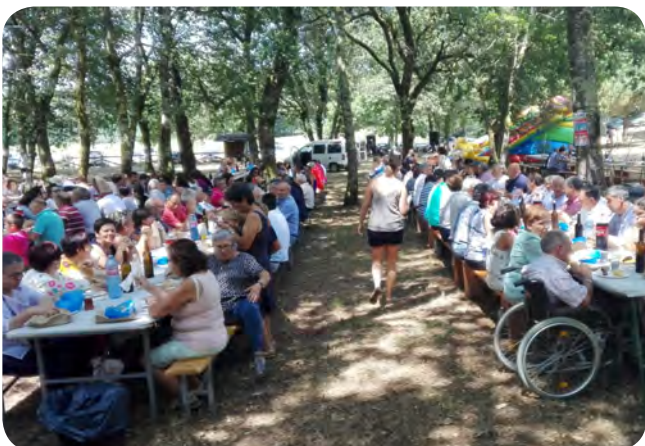
IX Festa do Chourizo en San Pedro de Sarandón o domingo 4 de agosto.